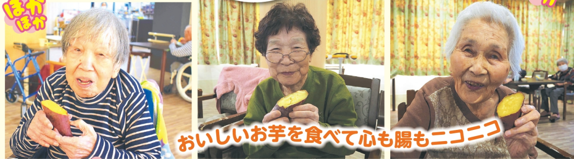
おいしいお芋を食べて心も腸もニコニコ

最近話題の「腸活」。腸内環境をバランスよく整えることを言います。また「腸脳相関」といって、腸の状態が脳に影響を及ぼすと言われるほど、腸は大変重要な臓器です。そこで、腸活に最も適したおやつの一つ「焼き芋」をご用意しました。焼き芋に使うサツマイモには、腸の動きを活発にする食物繊維が多く含まれています。さらにコレステロールや血糖値を下げる効果もあります。そして何より美味しいですよ。ホクホクの焼き芋で、腸も心も温まるひと時を過ごしました。