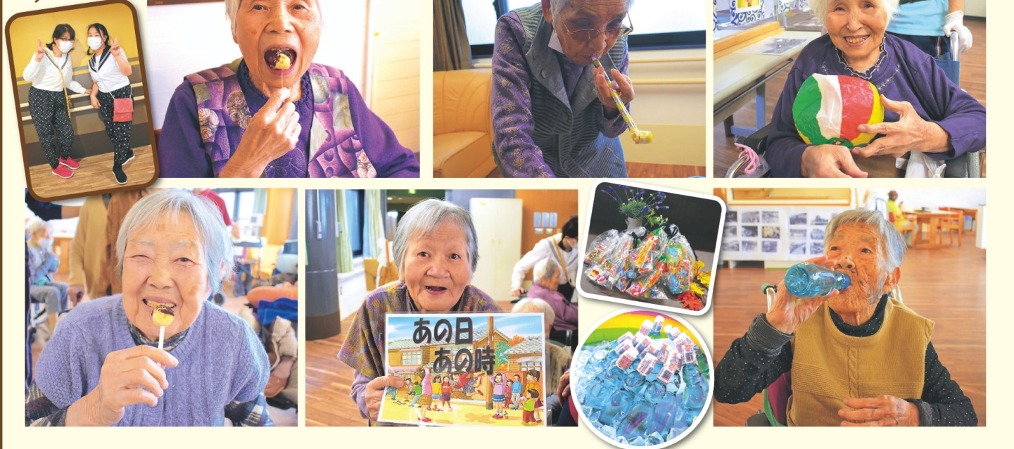
もんぺ美人？ 女学生登場

特養では午前中、機能訓練指導員による体操を実施しています。発声練習を通して誤嚥性肺炎を予防する口腔体操や、懐かしい音楽に合わせて身体を動かす体操を、みんなで楽しく行っています。